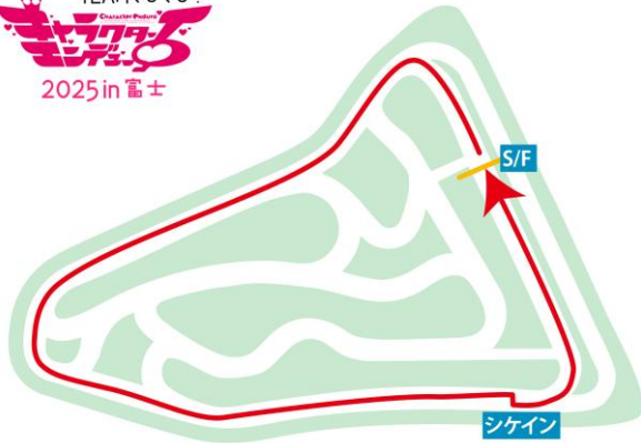
タイムトライアル/クリテリウムコース