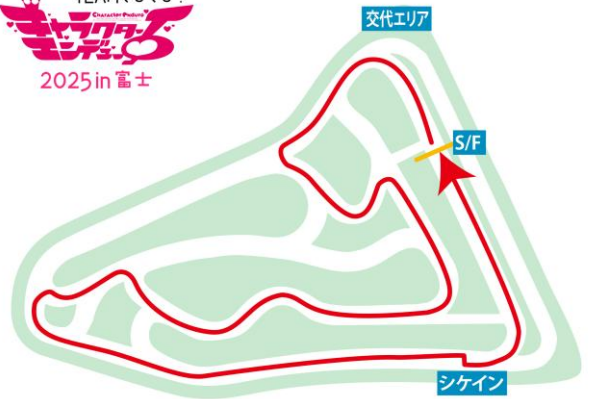
エンデューロ/サーキット鬼ごっこコース